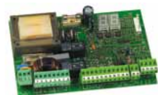
Motorsturing 455 D Technische spec. zie Pag. 187