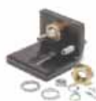
Mechanische aanslagen 'open'