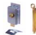
Diverse toebehoren Pagina 179