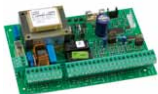
Motorsturing 462 DF Technische spec. zie Pag. 188