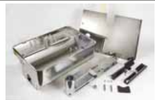
Zelfdragende huizing in roestvrij staal met ontgrendelingsmechanisme 110° (gepatenteerd)