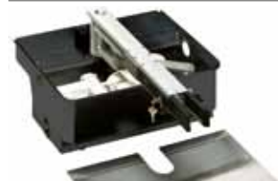
Zelfdragende huizing met ontgrendelingsmechanisme 110° (gepatenteerd)